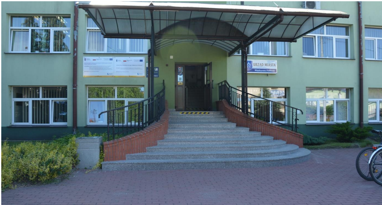
Budynek Urzędu Miasta widok od strony ulicy Pocztowej 8

Urząd Miasta w Międzyrzeczu Podlaskim to miejsce, w którym pracuje Burmistrz i urzędnicy.