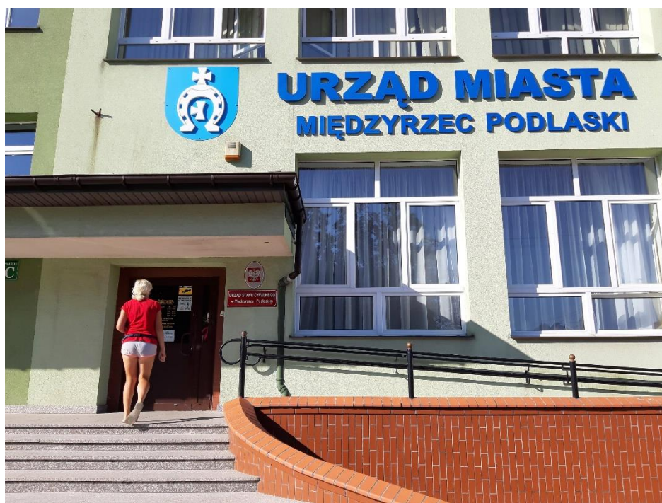
Budynek Urzędu Miasta widok od strony ulicy Warszawskiej

Do budynku prowadzą dwa wejścia. Wejście od ulicy Pocztowej 8 oraz wejście od ulicy Warszawskiej 37. Wejście od ulicy Warszawskiej jest dostępne dla osób niepełnosprawnych.